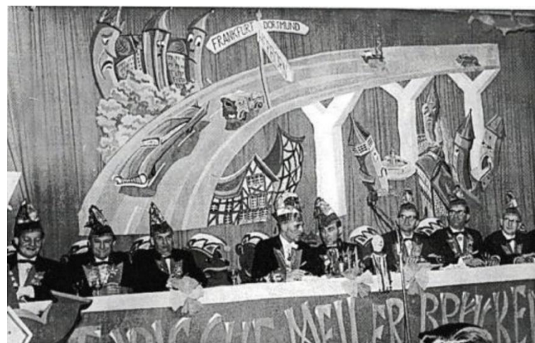
Abbildung 2: Bühnenbild 1965. Motto der Session: Historische Meiler - Brückenpfeiler. Festschrift zum 5x11 Jubiläum, 2003.

Der Karneval ist seit jeher Spiegel seiner Zeit und seine Akteure nutzen diesen traditionellen Brauch regelmäßig, um den „Oberen“ die Leviten zu lesen. Eine Fotografie des Bühnenbilds von 1965 thematisiert den geplanten Bau der neuen Bundesstraße, für den nach den damaligen Plänen sogar die Hohe Schule geopfert werden sollte. Hier sticht auch die durch Jockel Fleck beeinflusste Mainzer Tradition des politischen Karnevals heraus.