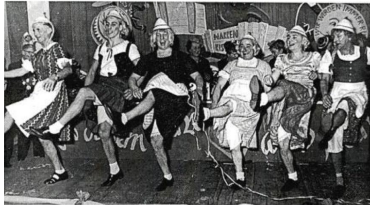
Abbildung 1: Ein Männerballett auf der provisorischen Bühne der Reithalle im Jahre 1959. Festschrift zum 5x11 Jubiläum, 2003.